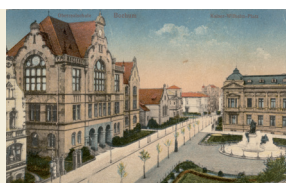
Goethestraße, Oberrealschule, Kaiser-Wilhelm-Platz, 1922 (heute Goethe-Schule)