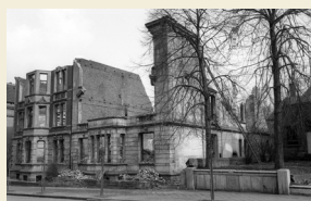
Goethestraße Nr. 8, nach 1945