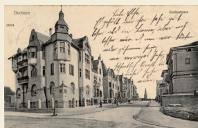
Goethestraße Nr. 20, 1909