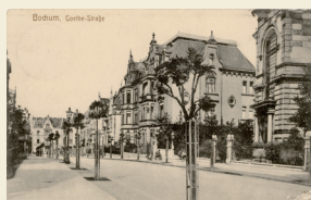
Goethestraße Nr. 8, 1908