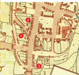
Anschnitt aus dem ältesten Bochumer Stadtplan, gezeichnet 1709 von Carl Arnold Kortum